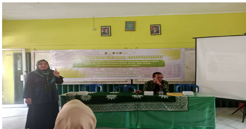
Gambar 3. Penyajian Materi

Muatan materi paparan menyangkut beberapa hal, yakni Media sosial dan peranannya di dalam masyarakat, makna dan hakikat linguistik forensik, cyber crime di media sosial dalam analisis linguistik forensik, dan Undang-Undang ITE. Siswa peserta yang berjumlah 31 orang sangat antusias dalam mengikuti kegiatan penyuluhan. Beberapa pertanyaan disampaikan sebagai bentuk rasa ingin tahu tentang linguistik forensik dan kaitannya dengan media sosial dan masalah hukum.