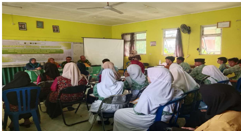
Gambar 4. Peserta Kegiatan

Muatan materi paparan menyangkut beberapa hal, yakni Media sosial dan peranannya di dalam masyarakat, makna dan hakikat linguistik forensik, cyber crime di media sosial dalam analisis linguistik forensik, dan Undang-Undang ITE. Siswa peserta yang berjumlah 31 orang sangat antusias dalam mengikuti kegiatan penyuluhan. Beberapa pertanyaan disampaikan sebagai bentuk rasa ingin tahu tentang linguistik forensik dan kaitannya dengan media sosial dan masalah hukum.