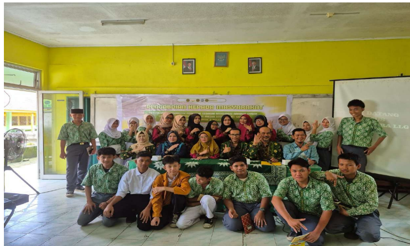
Gambar 5. Penutupan

Dampak paling signifikan adalah pergeseran pola pikir siswa dari mengabaikan pesan digital yang aneh menjadi menganalisisnya . Siswa menyadari bahwa media sosial adalah ekosistem bahasa, dan kecerdasan berbahasa di ranah digital adalah sama pentingnya dengan kecerdasan teknis.