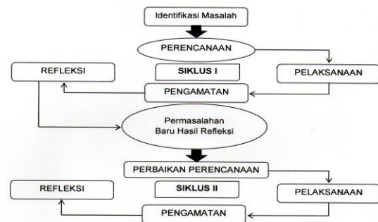
Gambar 1 Prosedur Penelitian Tindakan Kelas Model Stephen Kemmis dan Robbin Mc. Taggart

Adapun langkah-langkah tersebut jika dipaparkan dalam bentuk bagan sederhana yang dapat dilihat pada gambar di bawah ini :