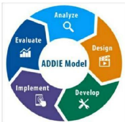
Gambar 1. Adopsi Dan Revisi Model ADDIE

Tahap pengembangan mencakup pembuatan produk wayang kreasi dan naskah cerita berbasis sejarah lokal Lampung. Produk yang dihasilkan selanjutnya divalidasi oleh ahli materi dan ahli bahasa untuk menilai kelayakan isi, kebahasaan, dan kesesuaian media dengan karakteristik siswa sekolah dasar. Tahap implementasi dilakukan melalui uji coba terbatas pada guru dan siswa sekolah dasar untuk memperoleh respon terhadap penggunaan media dalam pembelajaran. Selanjutnya, tahap evaluasi dilakukan untuk merevisi dan menyempurnakan produk berdasarkan hasil validasi dan respon pengguna.