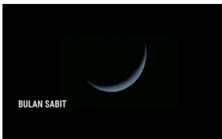
Gambar Part 13