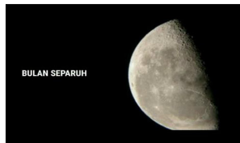
Gambar Part 14