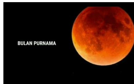
Gambar Part 12