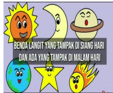
Gambar Part 2