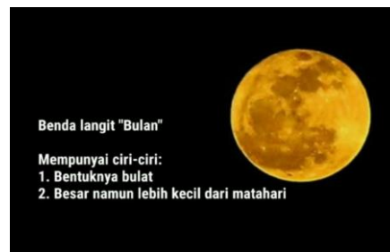
Gambar Part 10