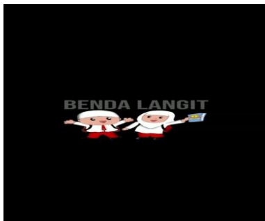
Gambar Part 1