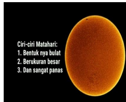
Gambar Part 4