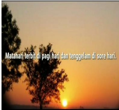
Gambar Part 7