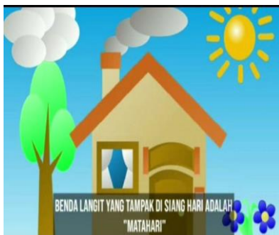
Gambar Part 3