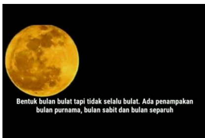
Gambar Part 11