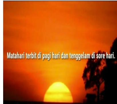
Gambar Part 8