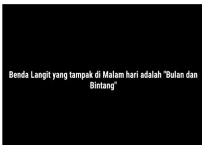
Gambar Part 9